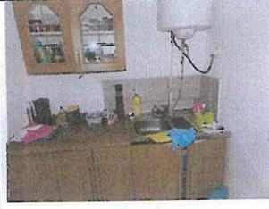
Interiér nebyt. priestoru č. 2