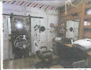
Interiér nebyt. priestoru č. 2