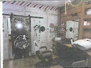
Interiér nebyt. priestoru č. 2