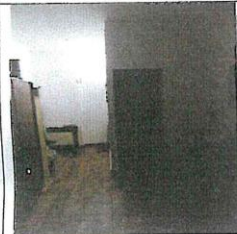
Interiér nebyt. priestoru č. 2