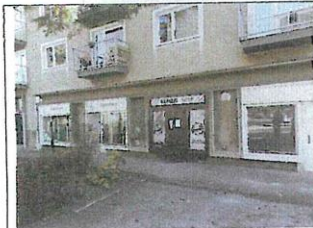
Nebytový priestor 2 v byt. dome č.s. 930