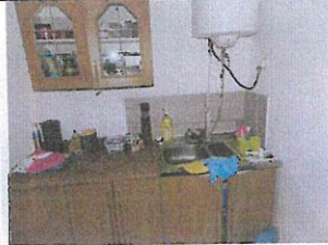
Interiér nebyt. priestoru č. 2