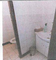
Interiér nebyt. priestoru č. 2