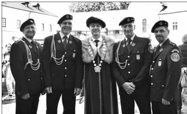
Úlohou mestskej polície bude zabezpečiť plynulý priebeh podujatia celé tri dni.

Okrem financií však často môžete prísť aj o doklady ako občiansky preukaz, cestovný pas, kreditné karty, či kľúče od auta alebo bytu. Pokiaľ je to možné, nenoste pri sebe väčšiu sumu peňazí alebo príliš drahé predmety. Ak už máte