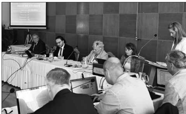
Na snímke záber zo zasadnutia Mestského zastupiteľstva mesta Kežmarok 14. júna 2023.

robloku Južná. Z týchto peňazí pokladnica zainvestuje aj do projektu mestského kú-