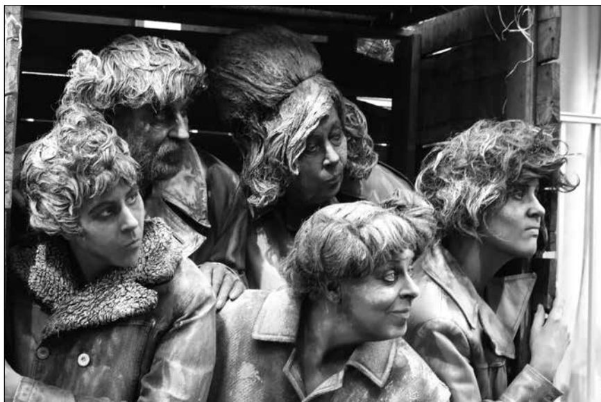
Živé sochy, ilustračný záber.

Program klasicky tvorí denná a večerná časť. Hrad tohto roku spustil novú spoluprácu. V rámci dennej časti programu budú mať návštevníci možnosť zažiť atmosféru komnát hradu spolu so živými sochami. Budú dohromady štyri, štylizované v tematických dobových kostýmoch. Ich úlohou bude umocniť atmosféru jednotlivých expozícií. Ak sa osvedčia, hrad ich v budúcnosti plánuje umiestniť do viacerých expozícií.