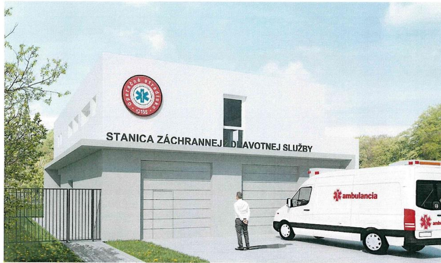
VIZUALIZÁCIA ČELNÝ POHľad