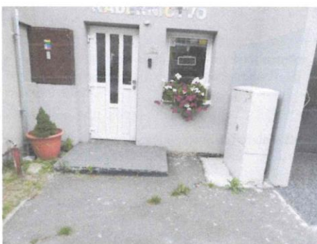
vstup do nebytového priestoru č. 12