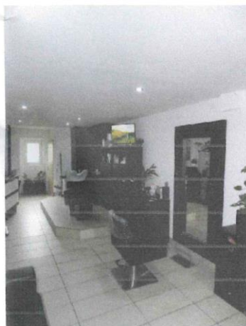
pohľad -interiér nebytového priestoru č. 12