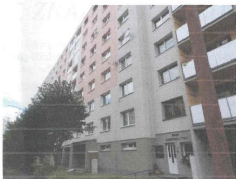
pohľad bytový dom č.s. 1718