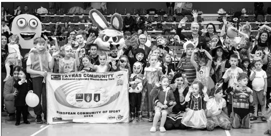
Záber zo slávnostného otvorenia športového karnevalu.

Celý karneval sa niesol v mimoriadne zábavnej a chytľavej atmosfére. Športovú halu na tento účel vyzdobili fašiangovou výzdobou a množstvom balónov. Motívom športového karnevalu boli známe a deťmi zvlášť obľúbené postavičky Mimoňa a Zajkka Kežmarka.