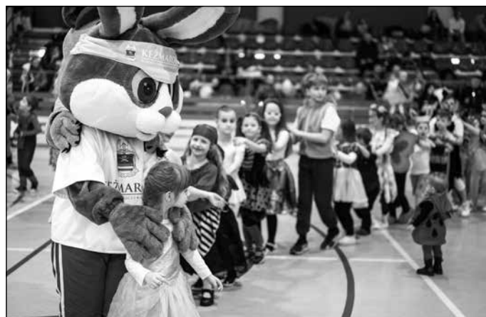
Mesto Kežmarok a Centrum voľného času Kežmarok zorganizovali 11. februára v Mestskej športovej hale Vlada Jančeka športový karneval. Okrem skvelej zábavy v maskách na Kežmarčanov čakal športovo-animálny program, súťaže a tombola. Podujatie sa konalo v rámci Európskej komunity športu 2024. Vladimír Mikolajčík, foto: Peter Cintula