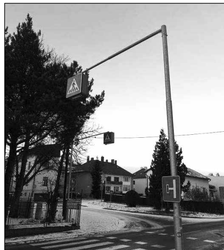
Priechod pre chodcov pri futbalovom štadióne F1 v Kežmarku.