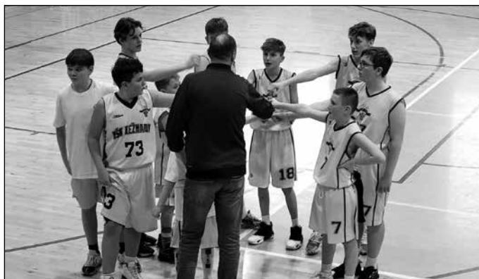
Začiatok zápasu s pokynmi trénera.

Sezóna našich kategórií je už v plnom prúde. V podstate sme už takmer v polovici. Kategória U13 mo-