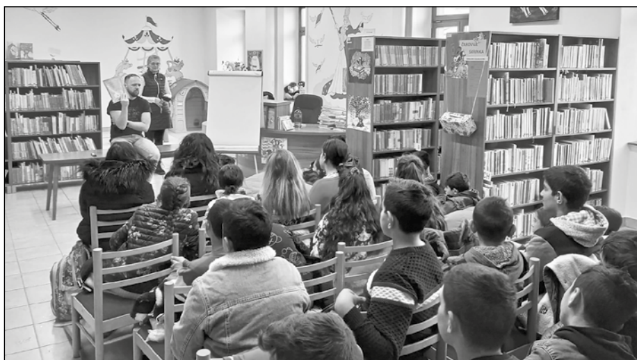
Knižnica poskytuje workshopy a tvorivé čítania aj pre deti z okolitých miest a obcí.

spevku z verejných zdrojov Fondu na podporu umenia v minulom roku bol poskytnutý mestu Kežmarok príspevok vo výške štyritisíc eur na dotáciu projektu Knižnica – nádej pre budúcnosť človeka. Z takto získaných prostriedkov sa zakúpilo 307 knižničných jednotiek. Knižný fond sa doplnil literatúrou pre dospelých v počte 204