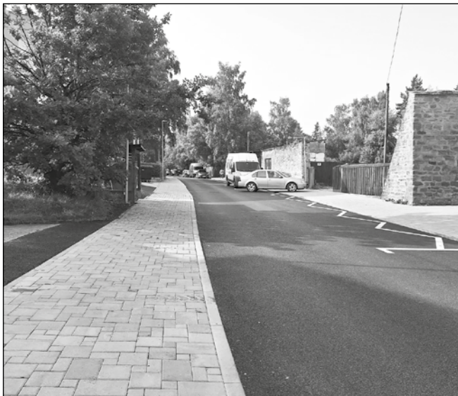
Chodníky a cesty na Baštovej ulici prešli rekonštrukciou pred minuloročným ELRO.

Máme opravy, ktoré budú vykonané v rámci rámcovej zmluvy. To sú opravy na Ulici Krvavé pole