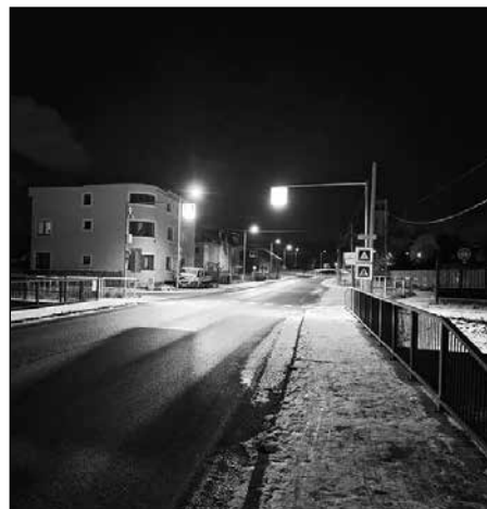
Priechod pre chodcov medzi Weilburskou ulicou a Lubicou cestou.