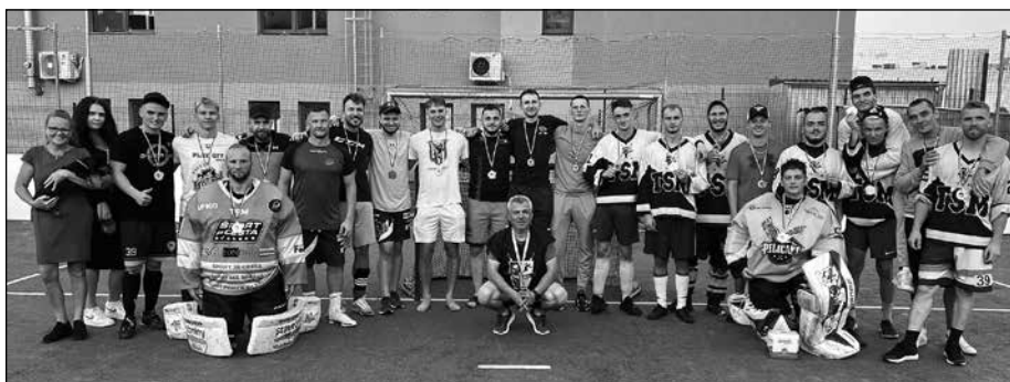
Šport je cesta aktívne spolupracuje aj s Centrom voľného času v Kežmarku.