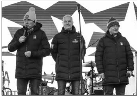
Snímka z oficiálneho predstavenia vlajky Európskej komunity športu 2024 v Liptovskom Mikuláši.

V Liptovskom Mikuláši pôsobí mnoho športových klubov, združení, oddielov či organizácií. Za zmienku stojí skutočnosť, že Liptovský Mikuláš hral počas dvoch predošlých sezón najvyššiu slovenskú futbalovú ligu. Mesto popritom – pokiaľ ide striktne o šport – nezabúda v možnostiach športového vyžitia na širokú verejnosť. „Opäť sme potvrdili, že vytvárame skvelé podmienky pre amatérskych aj profesionálnych športovcov,“ uvádza mesto v súvislosti s komunitou športu na svojom webe.