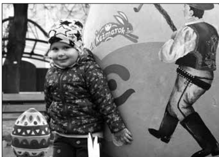
Výstava kraslíc v parku sa už stáva tradíciou.

Pri zážitkovom behu Nox quaerox ide hlavne o zábavu, netradičné trávenie voľného času a príjemne prežitý jarný večer. Preto sa vôbec nemusia báť tí, ktorí nie sú profesionálni športovci. Nox quaerox je súťaž dvojíc na princípe orientačného behu. „Súťažiaci, ktorí na beh prídu kvôli prekonávaniu rekordov, sa budú snažiť ukázať aj inú stranu