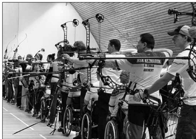
Lukostrelecká súťaž v hale Focus+ minulého roku.

Slovenský zväz lukostrelby nás poveril organizovaním majstrovstiev Slovenska v halovej lukostrelbe dospelých, z ktorých finálové súboje boli prvýkrát vysielané do všetkých krajín sveta. Poznáme víťazov v dvojnástich rôznych kategóriách. Toto podujatie sa konalo v hale Focus+, bola to zaťažková skúška pre náš