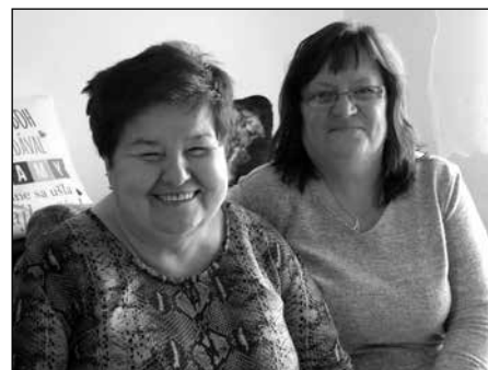
O pohodlie seniorov sa stará 30 stálych zamestnankýň mesta.

Mesto Kežmarok ako žiadateľ plánuje vybudovať 26 nabíjacích staníc, čo predstavuje celkovo 52 nabíjacích bodov v jedenástich rôznych lokalitách v troch veľkých oblastiach. Prvou oblasťou sú sídliská, celkovo sa plánuje osadiť na piatich sídliskách 15 nabíjacích staníc s tridsiatimi nabíjacími bodmi a docieľť tak, aby občania mesta nemuseli chodiť nabíjať svoje vozidlá ďaleko od svojich obydlí. Ďalšou oblasťou je historické centrum mesta. Tu sa plánuje osadiť päť nabíjacích staníc s desiatimi nabíjacími bodmi v mestskej pamiatkovej rezervácii. Poslednou skupinou lokalít sú verejne dostupné miesta ako centrum integrovanej starostlivosti, zimný štadión a športová hala, kde sa plánuje osadiť šesť nabíjacích staníc s dvanástimi nabíjacími bodmi, ktoré budú slúžiť nielen občanom žijúcim v blízkosti týchto miest, ale aj ostatným návštevníkom mesta. Cieľom projektu je zabezpečiť bezproblémovú dostupnosť nabíjacích staníc, čo zvýši využívanie vozidiel na alternatívny pohon. Projekt prispeje k rozšíreniu infraštruktúry pre alternatívne pohony, k zlepšeniu verejného zdravia znížením znečistenia ovzdušia a hladiny hluku. Dotácia poskytovaná Minis-