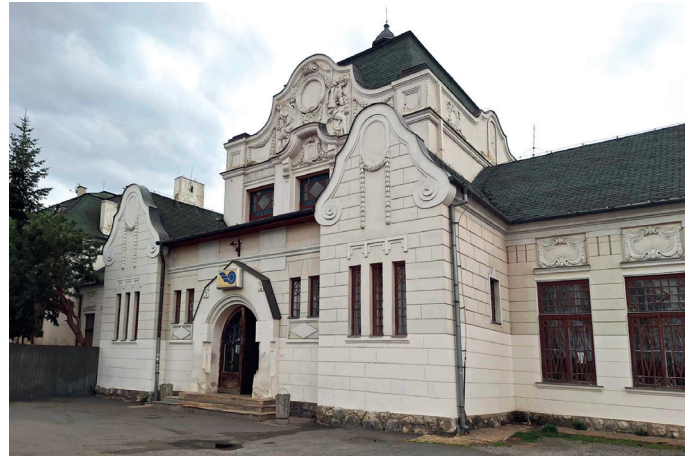
Železničná stanica v Kežmarku stojí už takmer 110 rokov.

V rámci tejto investičnej akcie sa počíta s komplexnou rekonštrukciou strechy a bleskozvodu, ohrevom žľabov a zvodov, výmenou klampiarskych konštrukcií, výmenou okien a dverí. „Rekonštrukcia sa nedotkne tých dverí, ktoré musia byť zachované. Tie budú repasované,“ doplnila informácie Lizáková. Viditeľnou bude taktiež