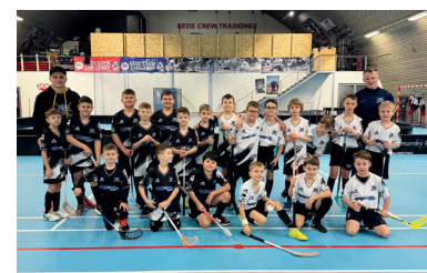
Hráči florbalovej akadémie na jednom z turnajov.