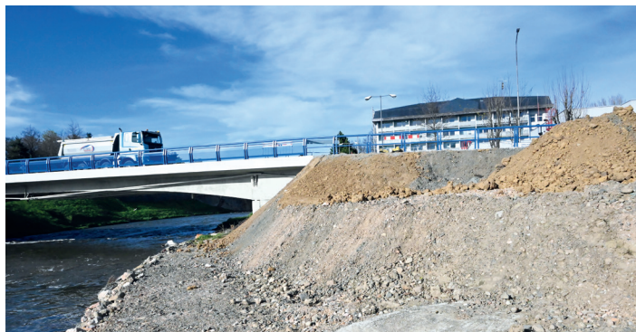
Miesto pod mostom, na ktorom bude stáť cyklochodník.

V tomto bode treba poznamenať, že cyklochodník z oboch strán už nebude