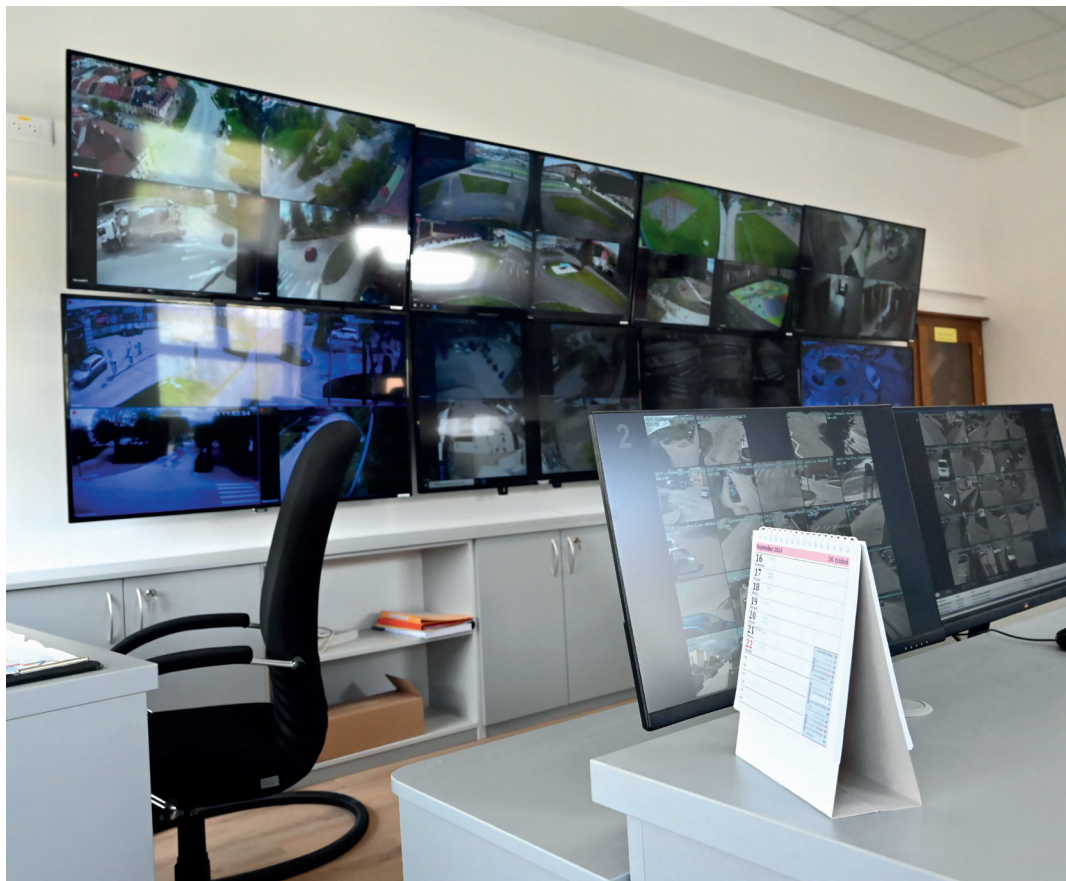
Na snímkach vynovené priestory operačného strediska Mestskej polície Kežmarok.

poriadku poskytuje mestskej polícii aj kamerový systém, vďaka ktorému bolo zistených 431 protiprávných konaní.