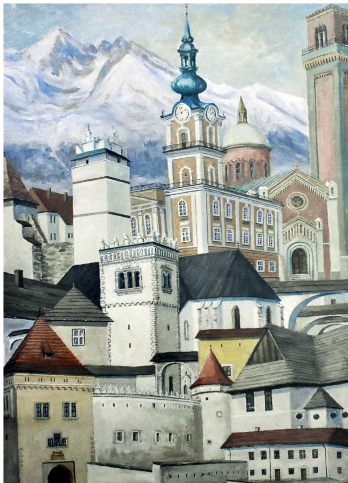
Propagačný materiál festivalu ELRO z dielne Alexandra Gallyho.

Ondrej Miškovič, zdroj: Beáta Oravcová, foto: Ondrej Miškovič z podkladov Alexandra Gallyho