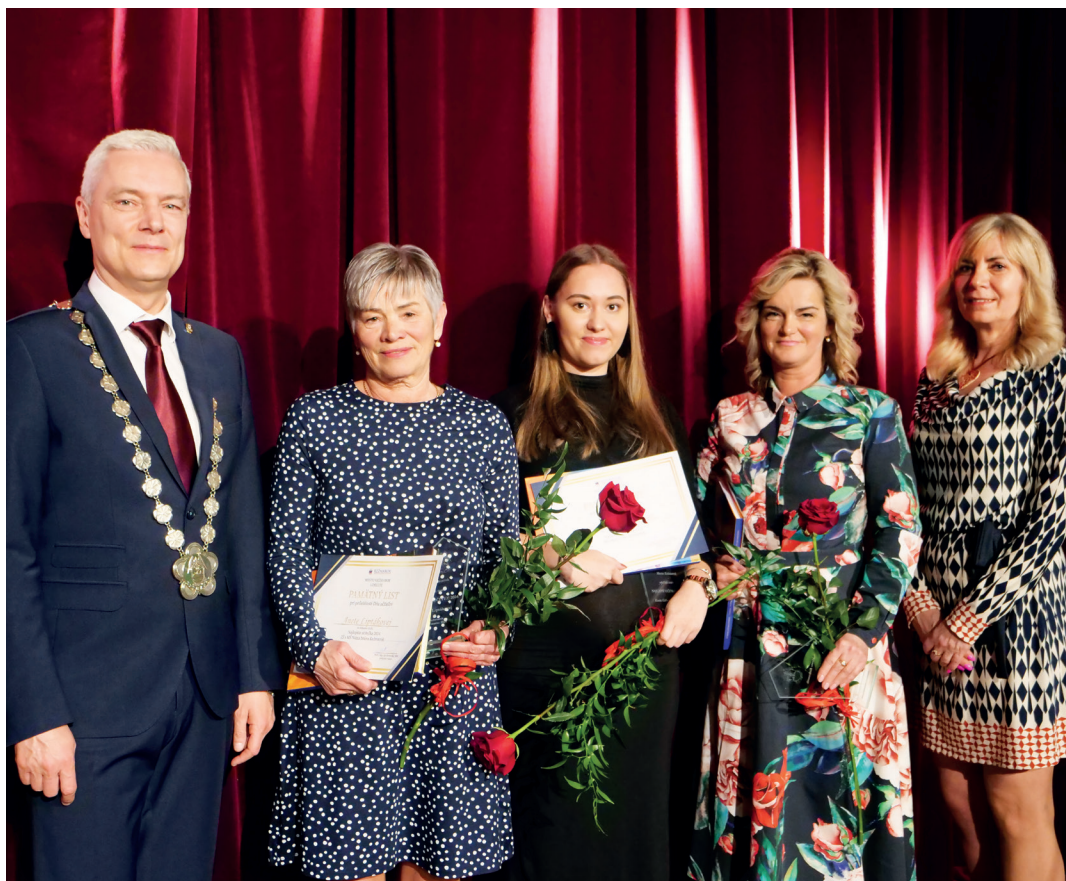
Ocenené pedagogičky materských škôl.

Rodičia žiakov z druhej najpočetnejšej materskej školy v pôsobnosti mesta