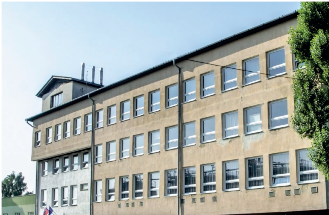
Škola umeleckého priemyslu Kežmarok na Slavkovskej ulici.

Zvýšenie nájomného v meste Kežmarok pre Hotelovú akadémiu Otta Brucknera (HAOB) a Školu umeleckého priemyslu Kežmarok (ŠUP) bolo motivované zmenou okolností a dlhodobou nečinnosťou zo strany Prešovského samosprávneho kraja (PSK) a škôl. Mesto Kežmarok sa pritom opakovane snažilo s PSK dohodnúť na kompromise, s ktorým by boli spokojné všetky zúčastnené strany.