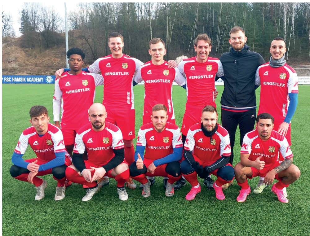
Zostava kežmarských futbalistov.