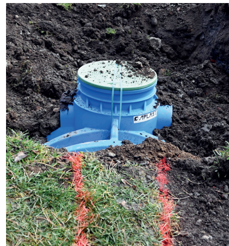
Na snímke vrchný poklop retenčnej nádrže v areáli Základnej školy s materskou školou Nižná Brána.

Projekt okrem spomínaných hlavných prvkov rátať aj so sekundárnymi riešeniami úpravy okolia dotknutých lokalít. Pribudol tak mobiliár v podobe lavičiek, odpadkových košov či stojanov na bicykle. Celé okolie spomenutých lokalít finálne upravili i množstvom zelene. Počty kusov novovysadených rastlín v rámci dažďových záhrad projekt ráta v tisícokach. Ide všetko o rastliny, ktoré vhodne zvýrazia charakter týchto miest. Miesta navrhli tak, aby aj v období sucha, ale aj v období dažďov boli plné