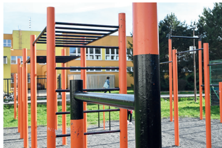
Na snímke záber na prvé workoutové ihrisko na sídlisku Juh.

Boom, ktorý sa po otvorení tohto prvého workoutu-