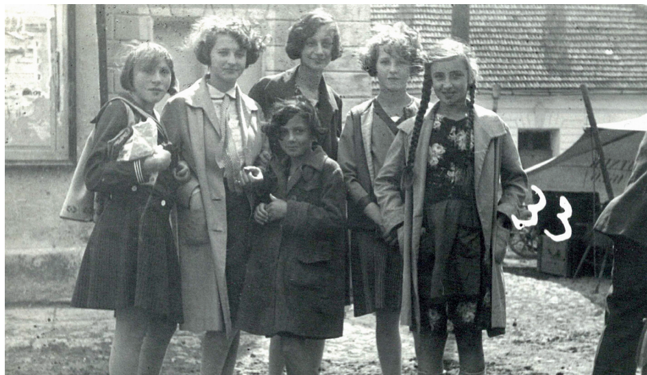
Skupinka židovských dievčat.

Keď sa v marci 1942 rozbehli smutne známe deportácie do koncentračných táborov, počet školákov postupne klesal. Ministerstvo školstva preto v júli 1942 neuznalo za potrebné zriadiť tretiu triedu pre nízky počet žiakov. Ostalo ich iba 71. V polovici septembra bolo číslo ešte nižšie – 57. K 1. júnu 1944 navštevovalo školu 48 žiakov. Vypuknutie Slovenského národného povstania koncom augusta