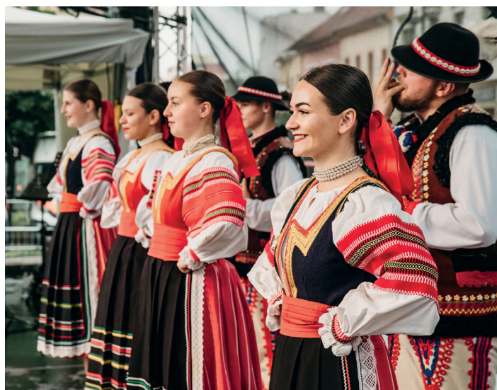
Záber z vystúpenia Folklórneho súboru Magura.

O pár mesiacov tu máme festival ELRO. Doteraz sa nestalo, žeby FS Magura na najvýznamnejšej udalosti nášho mesta chýbala. Podobne to bude i tento rok, keďže festival ELRO už klope na dvere. Na FS Maguru sa