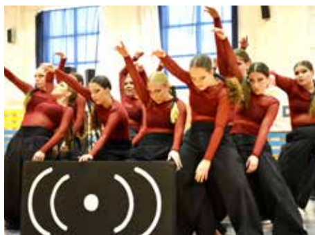
So svojou choreografiou pricestovali i tanečnice zo Svitú.