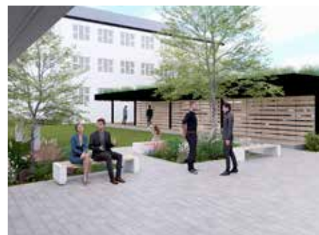
K dispozícii bude aj vonkajší altánok.