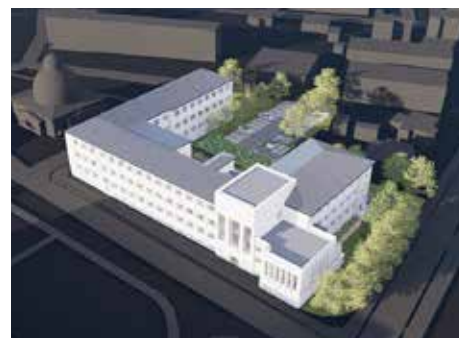
Pohľad na prednú časť objektu.