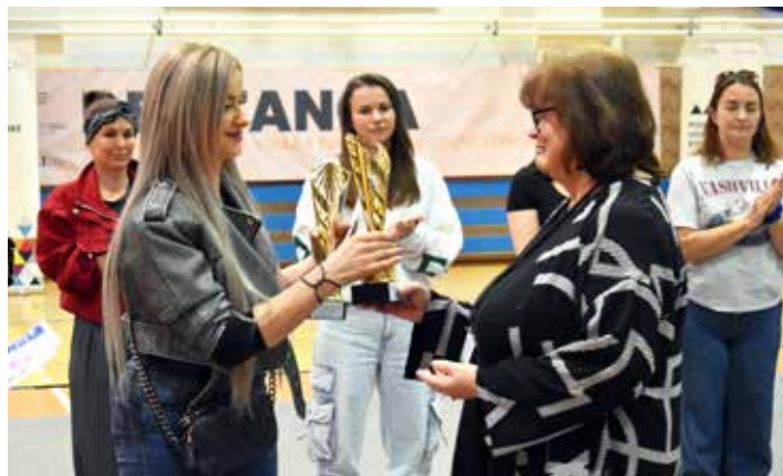
Kežmarský klub získal viacero ocenení.