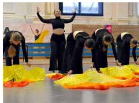
Kežmarčanky predviedli viacero choreografií.