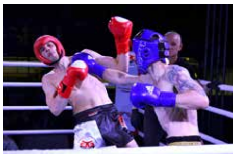
Zápasníci zvädzali tvrde súboje .