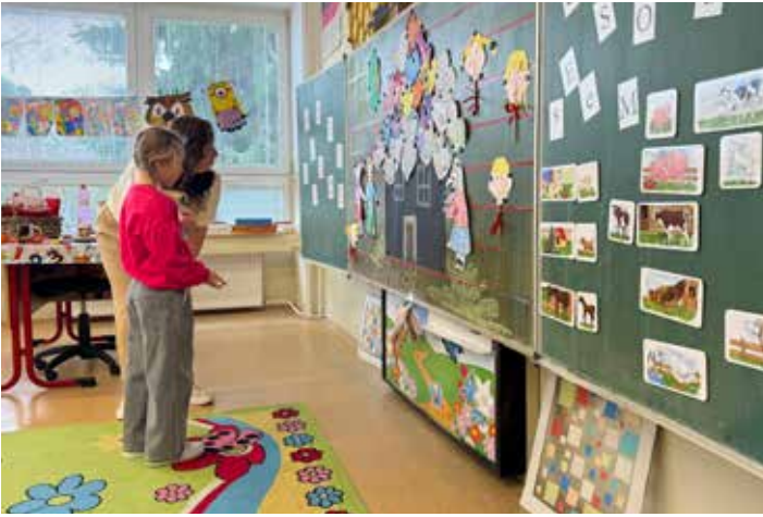
Ani priestorová orientácia deťom problém nerobila.