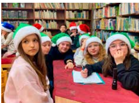
Malí trpaslíci pri riešení úloh.