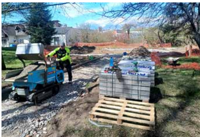
Prvé práce na stavenisku sa už rozbehli.