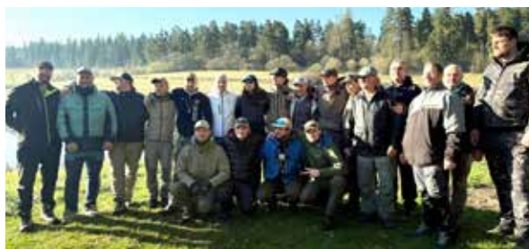
Súťažiaci na preteku na Zlatnej.

Súťaž prebiehala v súlade s pravidlami Slovenského zväzu športového rybolovu s aktuálnymi súťažnými predpismi pre LRU – mucha a modifikáciami platnými pre rok 2026. Pretekári si tak zmerali sily počas dvoch súťažných dní v 6. kolách a za presne definovaných podmienok. Podujatie bolo zaradené do bodovania LRU-mucha pre rok 2026 ako 40-bodové jazerné preteky, čo predstavuje ich význam v rámci sezóny. Každý bod bol pre účastníkov dôležitý v boji o celkové poradie, a tomu zodpovedala aj vysoká úroveň nasadenia počas oboch súťažných dní. Zraz pretekárov sa konal na VN Zlatná – lokalita Hájovňa, kde bol zároveň situovaný aj štáb pretekov. Organizácia prebehla plynulo a účastníci ocenili pripravenosť trati