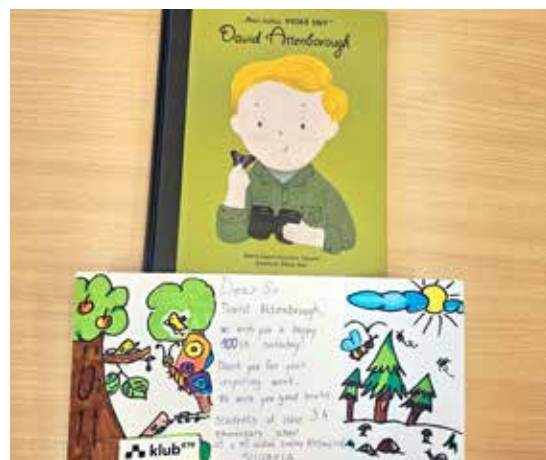
Vlastnoručne vyrobené blahoželanie.

Rozhodnutie padlo jednohlasne: Výnimočný človek si zaslúži výnimočné gesto. Žiaci sa rozhodli, že nenechajú tento historický milník bez povšimnutia a pripravili pre sira Davida vlastnoručne vyrobené blahoželanie k jeho 100. narodeninám. V liste, ktorý putuje z Kežmarku až do Londýna, mu mladí Slováci ďakujú za celoživotnú prácu a sľubujú, že poslanstvo ochrany prírody, ktoré Attenborough šíri, budú niesť ďalej. Pre členov AMAVET klubu nie je David len postavou z obrazovky, ale mentorom, ktorý ich inšpiruje k vedeckému bádaniu a úcte k životu vo všetkých jeho formách.