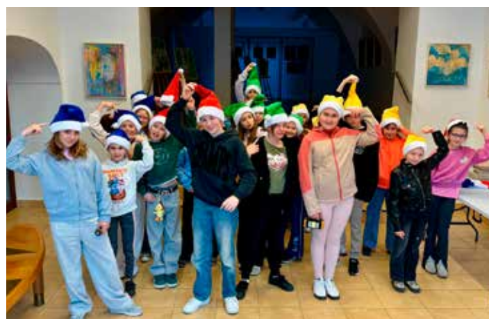
Tento rok sa deti predstavili ako trpaslíci.