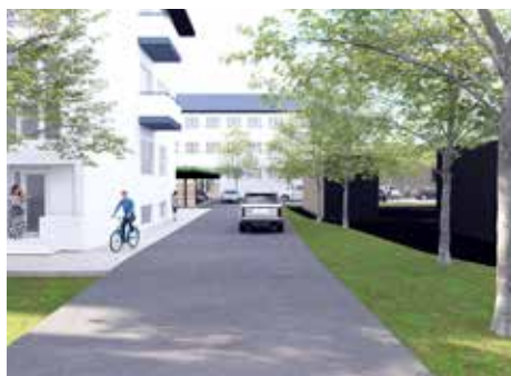
Dostupná bude aj prístupová cesta.

Svoje pôsobisko zmení aj Mestská polícia Kežmarok,