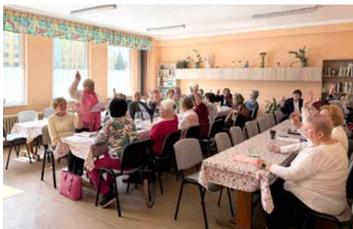
Delegáti si jednohlasne zvolili predsedníčku.