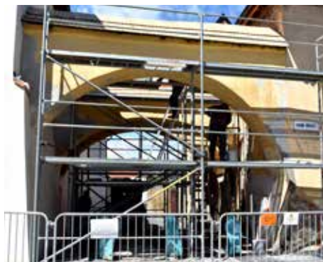
Na historických oblúkoch sa začali opravy.

Už počas minulého roka sa v rámci leta rozbehla obnova historických rozperných oblúkov na kežmarskom námestí. Zrekonštruované budú aj oblúky vo vedľajšej uličke smerom k bazilike (vedľa budovy Korzo). Opäť rovnako ako pri ostatných oblúkoch, i tu sa budú dodržiavať prísne postupy