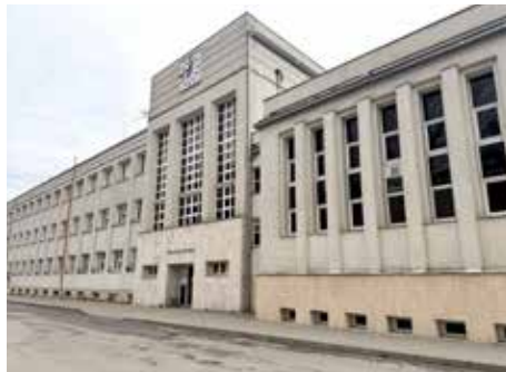
Pôvodná budova polikliniky.

ktorá sa taktiež presťahuje do nového objektu, kde je pre ňu vyhradený samostatný segment. V budove bude k dispozícii aj výťah, ktorý pomôže ľuďom s pohybovým obmedzením dostať sa tam, kam potrebujú. Novovybudované parkovisko sa stane prístupným nielen zamestnancom, ale i návštevníkom úradu. Dôležitou a praktickou súčasťou každej samosprávy je ucelený archív. Dnes má MsÚ svoj archív na 7 rôznych miestach. Architekti ho po novom sústreďujú v suteréne budovy s konštantnými klimatickými podmienkami.