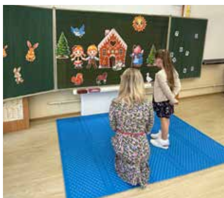
Spojená škola Hradné námestie pripravila Cestu do rozprávky.