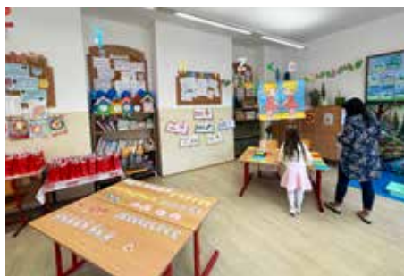
Rodičia majú dostatok času vychytať s deťmi do nástupu aj drobné nedostatky.