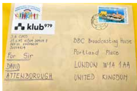
List pre Davida Attenborougha od našich detí.

Všetko to začalo jednou knihou. Žiaci z kežmarského AMAVET klubu sa počas svojich aktivít začítali do knihy David Attenborough – Malí ľudia, VEĽKÉ SNY, o výnimočnom prírodovedcovi a filmárovi. To, čo začalo ako bežné čítanie, prerástlo do hlbokého obdivu. Fascinovalo ich, ako jeden človek dokázal počas ôsmich dekád svojej kariéry priniesť divočinu z najvzdialenejších kútov Zeme priamo do našich obývačiek. „Jeho hlas je hlasom našej planéty. Ukázal nám nielen krásu, ale aj krehkosť sveta, ktorý musíme chrániť,“ hovoria nadšení členovia klubu.