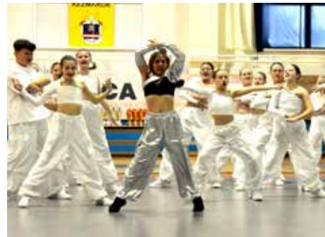
Niektoré choreografie spôsobili ošial' medzi tanečníkmi i divákmi.