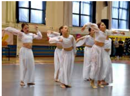
TK Dance Power sa predstavil takmer vo všetkých vekových kategóriách.