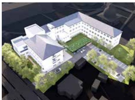
Využívaný bude celý objekt.

Oddelenie projektov a príprav investícií na MsÚ v Kežmarku vidí reálne aj vyhotovenie samotnej projektovú dokumentácie. „Celý projekt je v štádiu riešenia, aktuálne sa dokončil architektonický návrh. Treba podotknúť že predmetná budova bude po rekonštrukcii moderná, bezpečná, bezbariérová a bude spĺňať požiadavky nízkoenergetickej budovy, keďže časť elektrickej