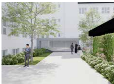
V okolí objektu bude množstvo zelene.