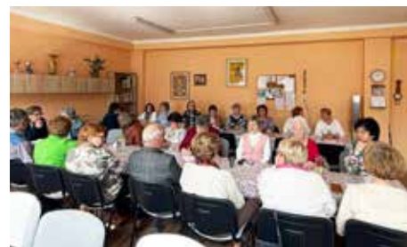
Na okresnom sneme si volili novú predsedníčku.

„Život prináša rôzne etapy a nastala taká doba, že sa budem lúčiť s profesionálnou kariérou športového funkcionára, odchádzam z Medzinárodnej lyžiarskej federácie. Je to pre mňa česť a som vďačná, že ste ma oslovili na kandidatúru za predsedníčku. Určite si spoločne poradíme. V každom meste nášho okresu Spišská Stará Ves, Spišská Belá a Kežmarok máme členské základne a každá z organizácií si dáva za cieľ rozširovanie členskej základne. Nemalo by to byť na úkor kvality. Skôr si myslím, že je dôležitá osвета, istý pozitívnym príkladom a aktivitami zvýšiť členskú základňu. Teším sa na spoluprácu s pánom podpredsedom