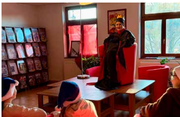
Deti museli zbierať body, aby porazili zlé kráľovnú.