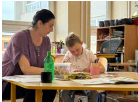
Poslednou úlohou bolo kreslenie postavy.

jednoslovné odpovede, rovnako zlyháva aj očný, niektoré dedičky sa verbálnej komunikácii cielene vyhýbali a kývali plecami. Nevie, zabudol som, dieťa nevedelo, čo robilo včera poobede. Mali sme chlapčeka, ktorý hovoril, že bol som na mobile. No na druhej strane sú zas deti, ktoré vás milo prekvapia a sú veľmi zbehlé. Tie napríklad prirovnali kocky k minecraftu, v tomto smere je to zas nápomocné. Všimám si aj to, že sme v minulosti nemali až také množstvo detí, ktoré mali zlú výslovnosť. Každé druhé dieťa posielame k logopédovi. Môže to byť