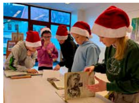
Noc s Andersenom je medzinárodné podujatie zamerané na podporu čítania.