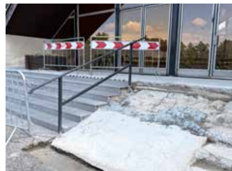
Rekonštrukcie sa dočkalo aj schodisko na novom cintoríne.

prac, ktoré kontroluje Krajský pamiatkový úrad, pracovisko Poprad. Z oblúkov bude odstránená stará omietka, farba a nanosená bude na nich nová s dlhotrváčnym a odolným náterom. Na týchto oblúkoch sa ďalej vymenia šindle, ktoré budú zo smrekového dreva. Cieľom obnovy je opäť o niečo viac zatraktivniť územie pre návštevníkov i občanov historického Kežmarku. Oprava rozpurných oblúkov je súčasťou projektu s názvom