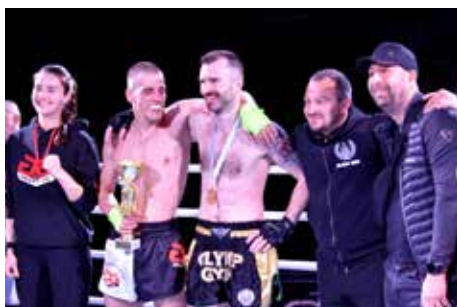
Po zápasoch však došlo na gestá fair-play a kama-rátsku debatu .