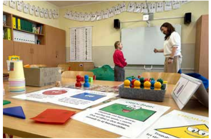
Predškoláci recitovali básičku alebo spievali pesničku.