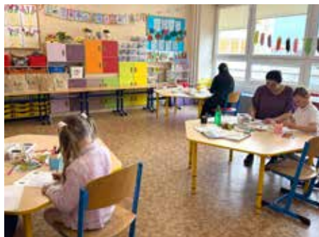
V učebni ZŠ s MŠ Nižná brána.