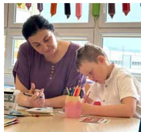
Budúci prváci sa veľmi snažili.