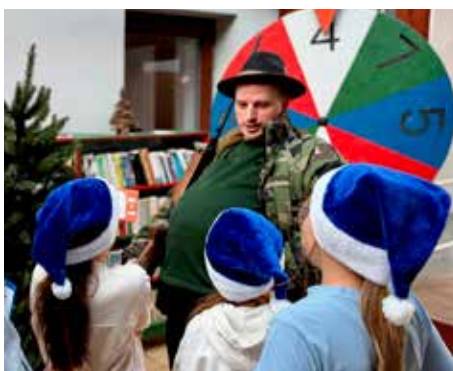
Najviac zaujal vtipný poľovník.