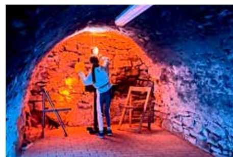
Časť programu sa odohrávala aj v podzemí pod mestskou knižnicou.