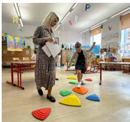
Barborku najviac potešila farebná cestička.